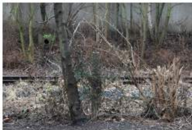
figure 2 : Extraits du reportage réalisé en février 2012. Cette figuration illustre le terme de « talus » sans rien montrer de la logique, de la structure ni du potentiel des espaces d'accotement. La photographie fait ici moins valoir les qualités de son modèle que sa propre puissance à l'esthétiser. Nous dirons qu'elle « arcadise » plus qu'elle n'artialise les talus, en cela qu'elle renvoie à un environnement foncièrement donné, que l'on n'a pas à produire ni à modifier.