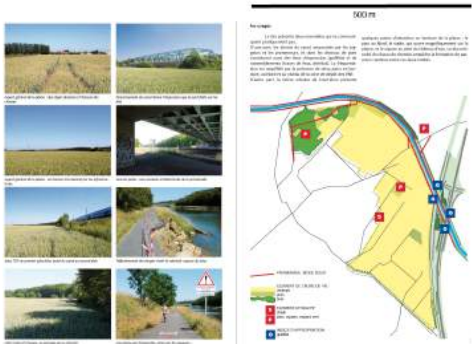
figure 3 : extrait d'un descriptif de l'une des plaines urbaines échantillonnées. En haut, carte indiquant les parcours et lieux d'échantillonnage des différents chercheurs de l'équipe : le simple fait de relever les mouvements et implantations des chercheurs induit un choix d'échelle, et donc un cadrage, qui a pour effet de circonscire un lieu et de passer d'une approche diluée dans la considération exclusive des linéaires d'accotements à une approche attachée à des surfaces plus composées, plus tangibles. L'objet de la recherche passe du talus à la plaine. En bas, carte des usages relevés sur la même plaine urbaine. La carte ne vaut que comme mode d'addition de faits relevés de manière autonome par la photographie. Mais ce faisant, elle contribue à fonder la plaine urbaine en tant qu'espace public de fait .

itinéraire du paysagiste itinéraire des photographes parcelles du botaniste (infrastructure / matrice) parcelles du zoologue transects des pédoogues