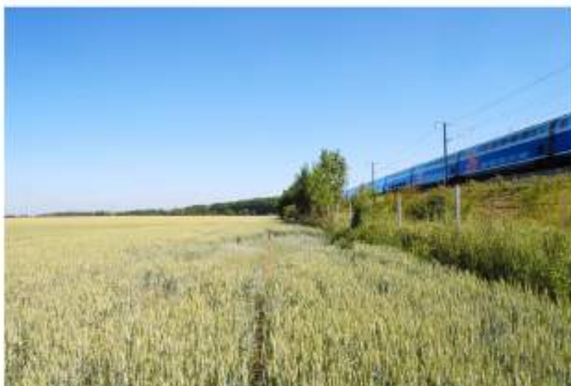
figure 5 : photographier le talus comme élément structurant des plaines urbaines.