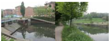
Le Port du Dragon - Wasquehal.