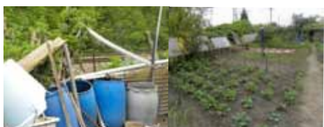
Jardins familiaux en bordure de la voie ferrée - Wasquehal.

Réaliser ce Portrait Nature Transfrontalier, c'est se questionner collectivement sur les opportunités que représente la voie ferrée Lille-Courtrai comme support de Trame Verte et de patrimoine bâti industriel. Les talus de la voie ferrée Lille-Courtrai forment-ils, avec leurs espaces attenants, une continuité d'espaces de nature encore méconnus, particulièrement précieuse en milieu urbain dense et qu'il faut aujourd'hui préserver? Le patrimoine architectural et technique, présents sur ces espaces hérités d'anciennes activités industrielles, est-il suffisamment protégé ?