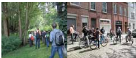
Visite exploratoire à Courtrai Jardin de Venning et vélo-route, 6 juillet 2012.